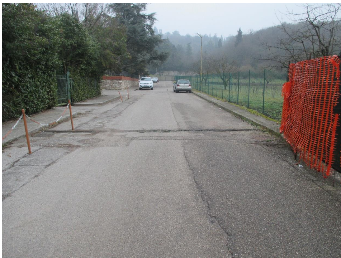
FOTO 2_Vista strada privata ad uso pubblico - accesso parcheggio