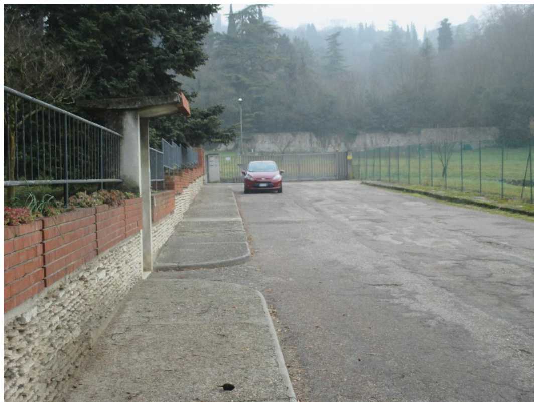
FOTO 3_Vista cancello entrata complesso residenziale esistente