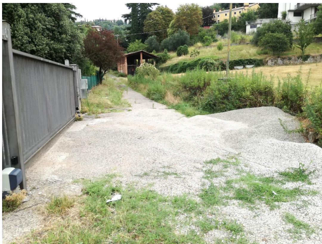
FOTO 8_ Vista attuale strada privata di accesso complesso residenziale esistente