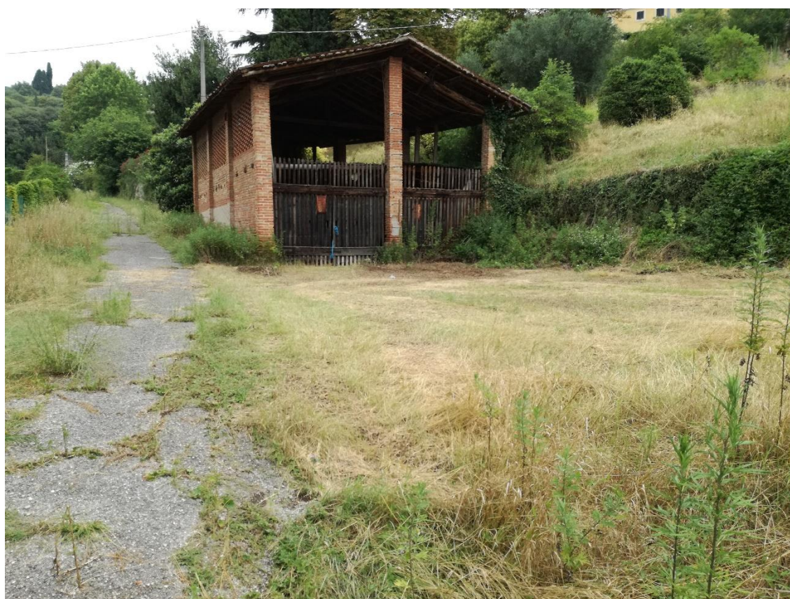
FOTO 10 _Vista attuale strada privata ad uso pubblico