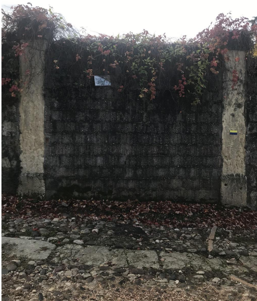
FOTO 12 _Vista attuale portone murato su via Sbusa – collegamento futuro previa demolizione