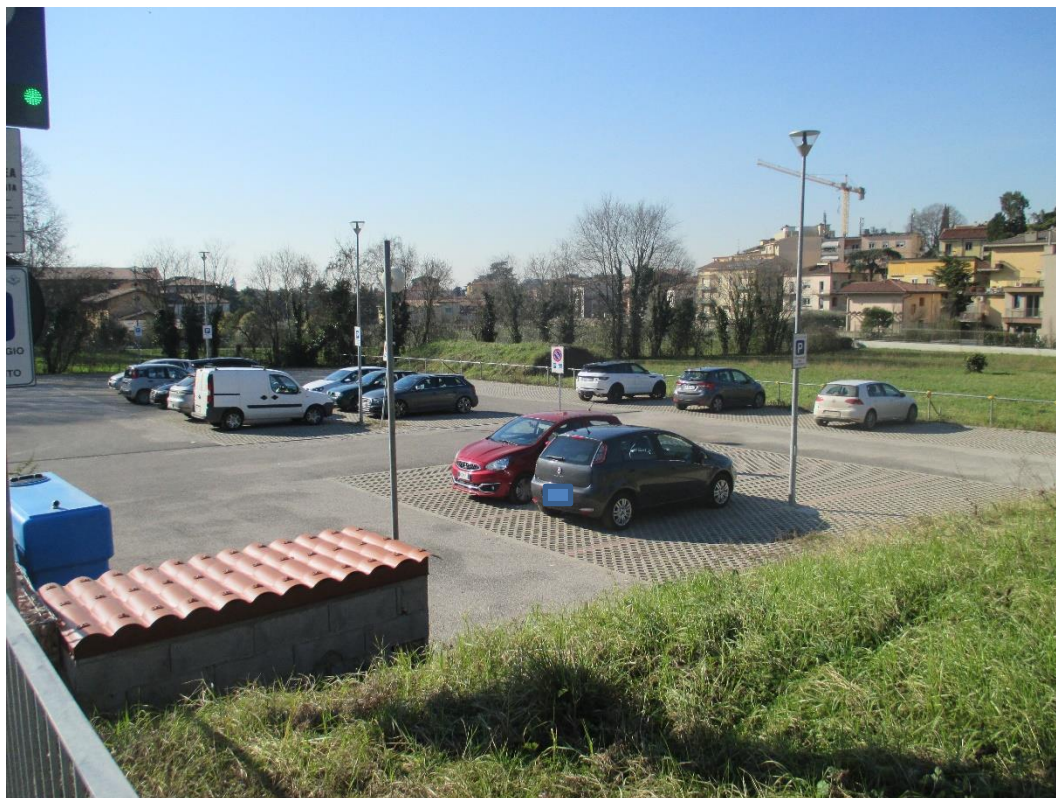
FOTO 5_Vista attuale parcheggio esistente