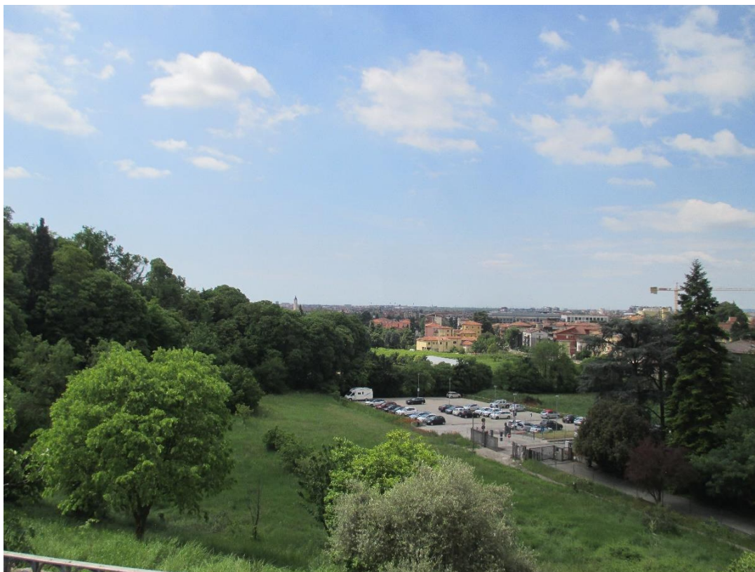
FOTO 7_ Vista attuale parcheggio e cancello entrata complesso residenziale