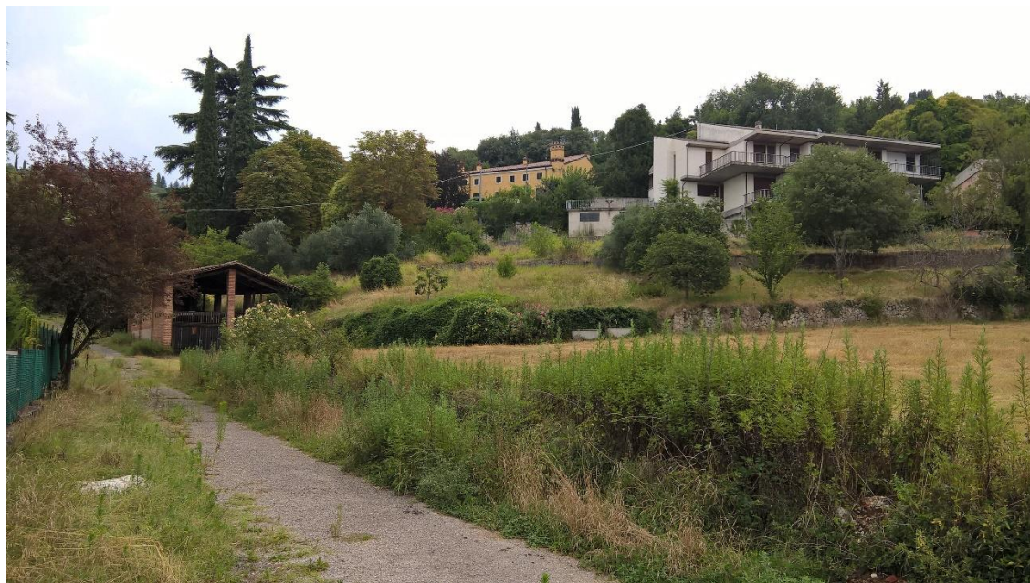
FOTO 9 _Vista attuale strada privata ad uso pubblico