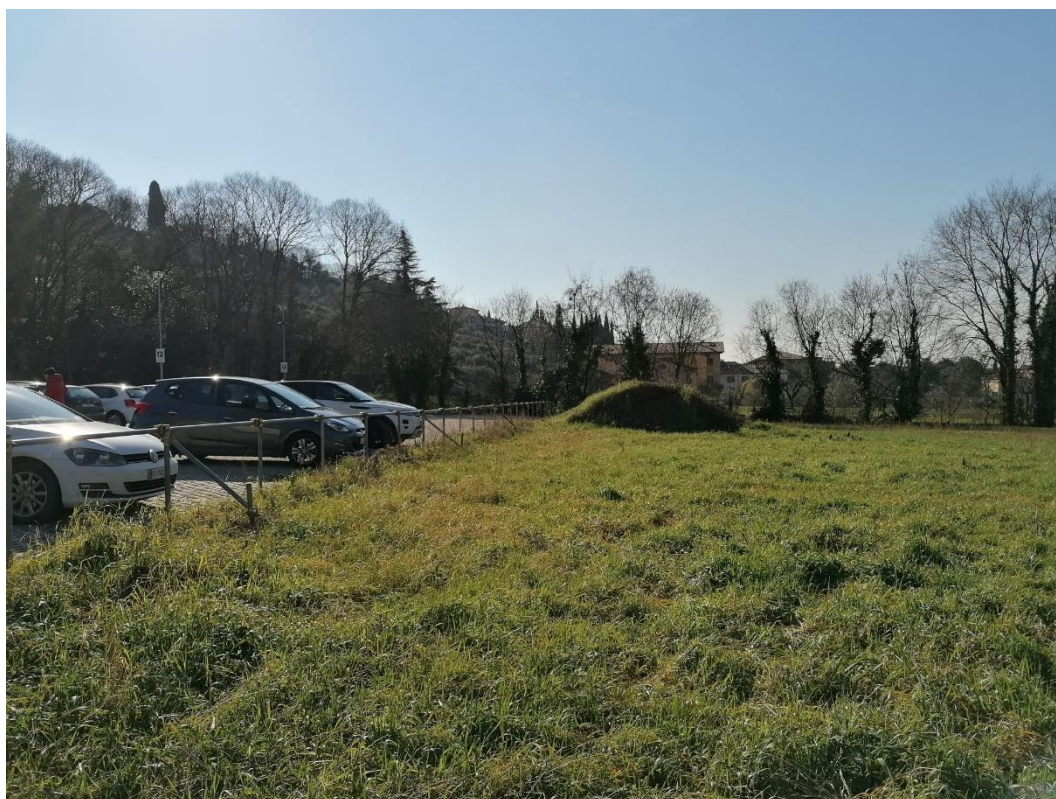
FOTO 6_Vista attuale parcheggio esistente