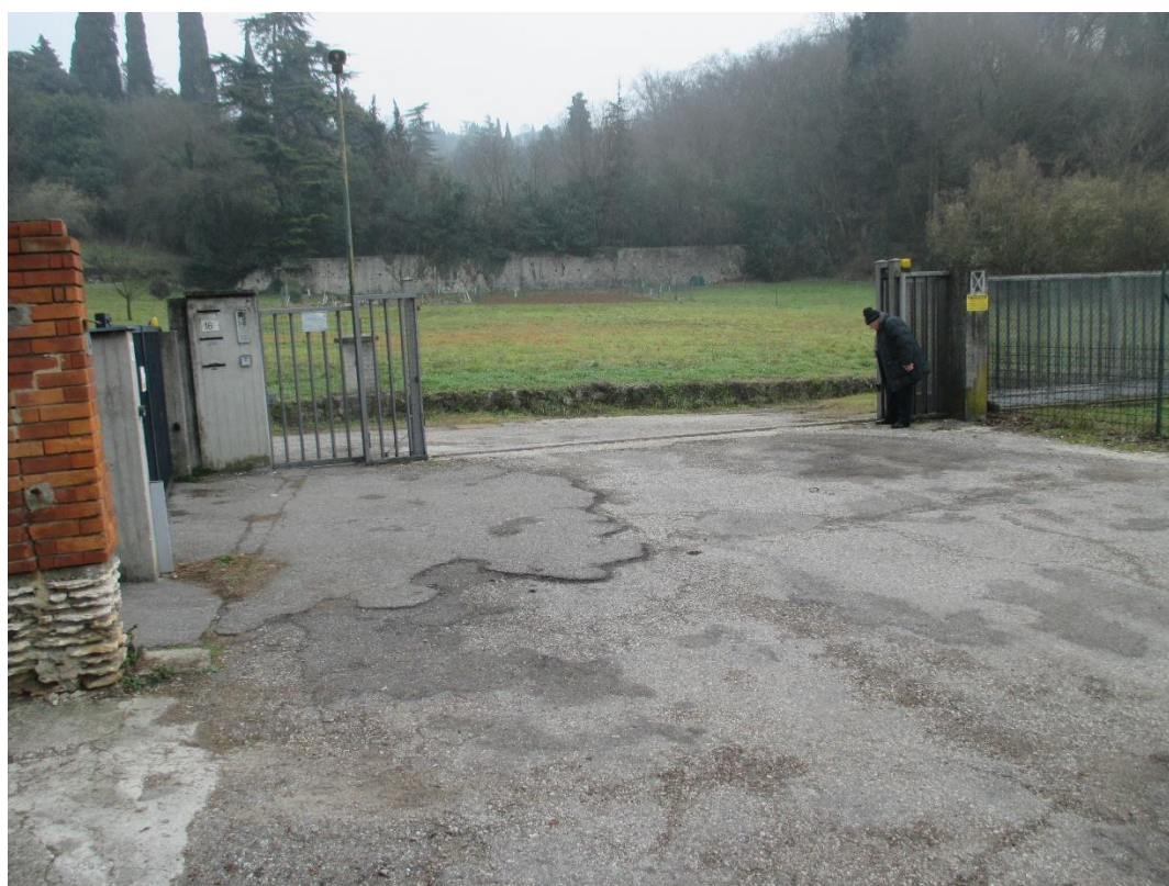
FOTO 4_Vista cancello entrata complesso residenziale esistente