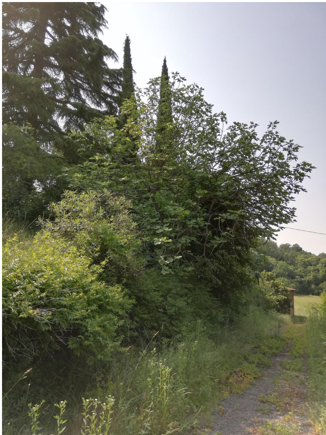
FOTO 11 _Vista attuale strada privata ad uso pubblico