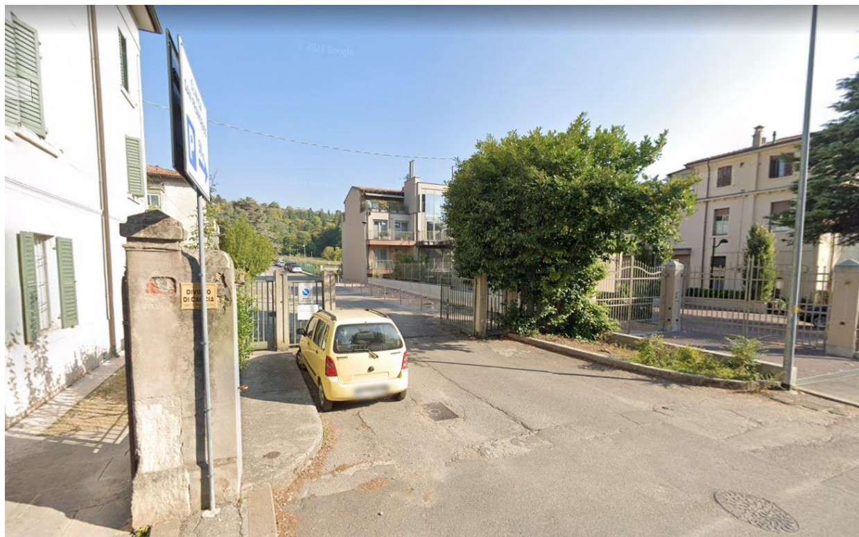
FOTO 1_Vista entrata strada privata ad uso pubblico - accesso parcheggio