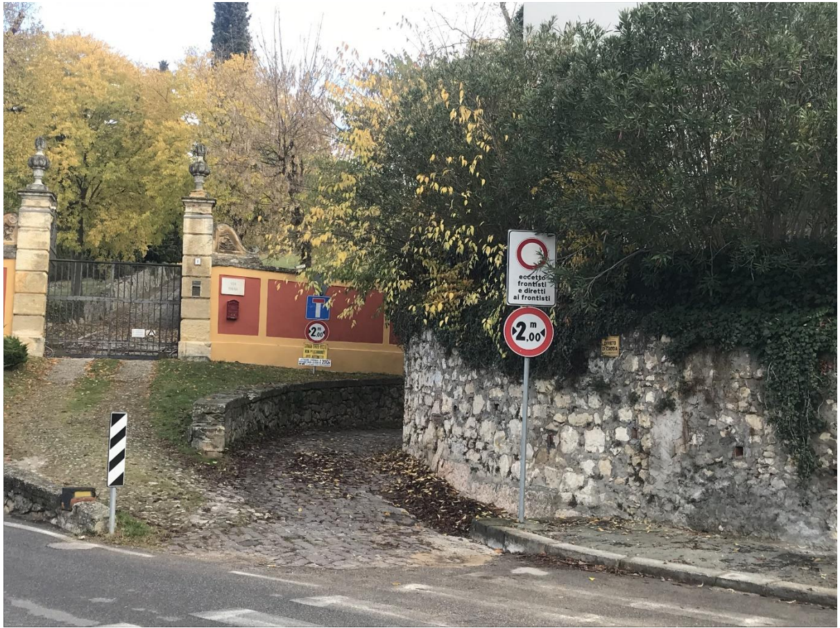
FOTO 14_Vista attuale entrata via Sbusa da via Monte Ortigara