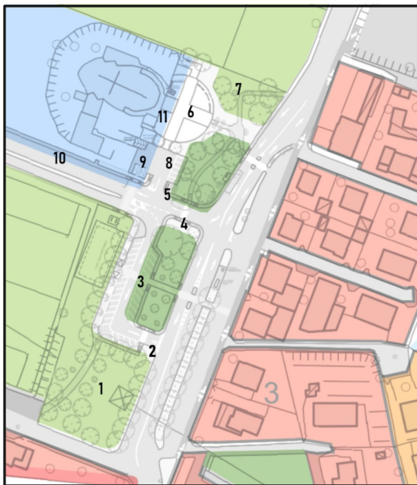
Sovrapposizione Progetto Definitivo al PI-T4

E' modificato il perimetro delle seguenti zonizzazioni