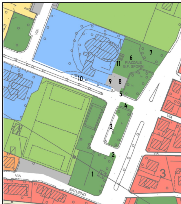
PI-T4 - stato modificato