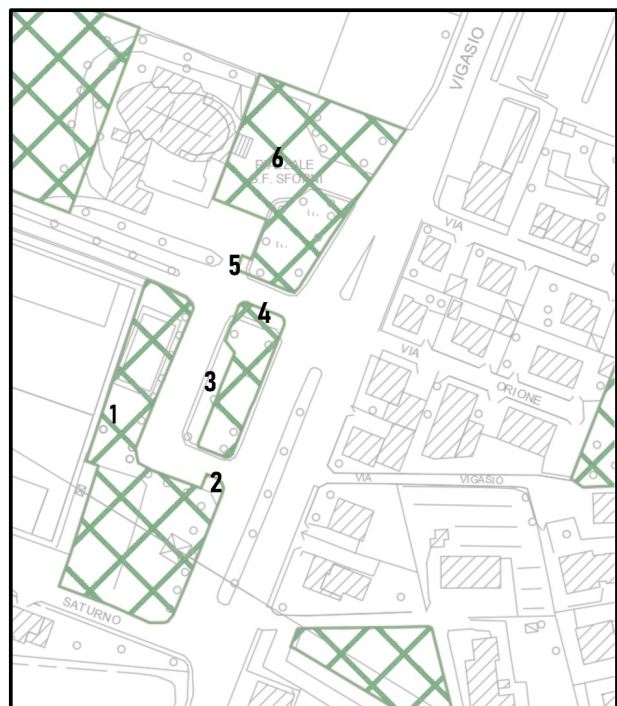
PI-T3.1 - stato modificato