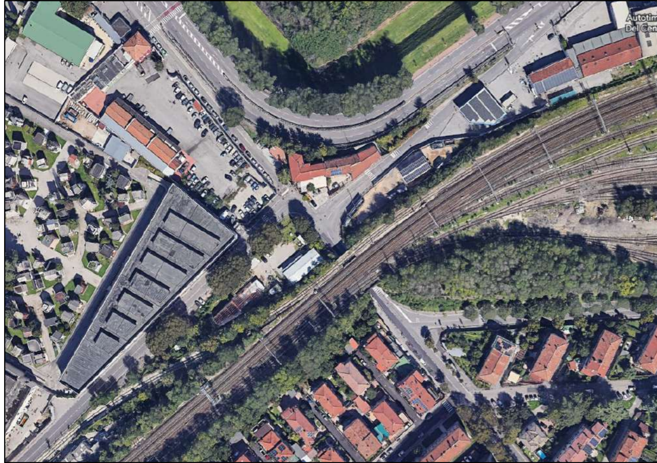
Vista aerea Via Da Vino - Via Campo Marzo - Via Ligabò

Nuova rotatoria all'incrocio tra le Vie Sebastiano Dal Vino, Via Campo Marzo e Via Ligabò nel territorio della 7 a Circoscrizione.